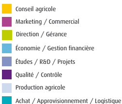
Diversité des secteurs