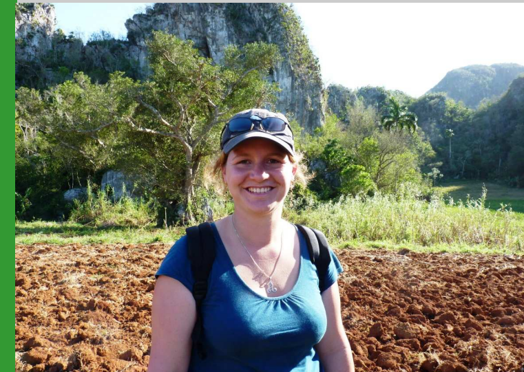
Etude d'une problématique agricole à l'étranger : l'agriculture urbaine à Cuba (Février 2011)